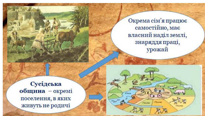
Малюнок 3. Сусідська община