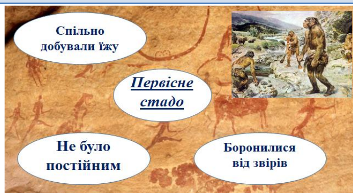
Малюнок 1. Первісне стадо