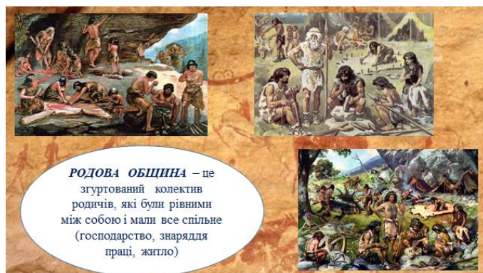
Малюнок 2. Родова община